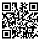
いっぽ ホームページ