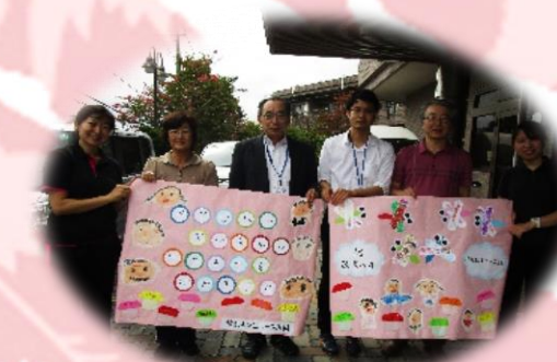
ルンビニー保育園の園児達より