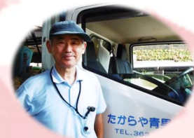
たからや青果店様