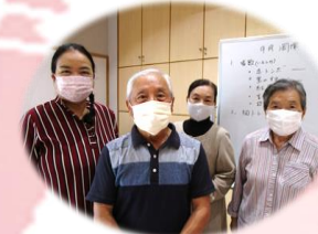
岡津サロンの皆様