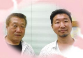
ウタガワ理容室様