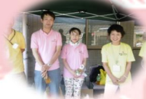
ヘルパーステーション泉様