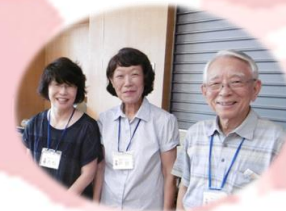
傾聴ボランティア・モモ様

たくさんの方々からお祝いのメッセージを いただきました！ 本当にありがとうございます