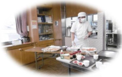
新橋ホームの寿司職人