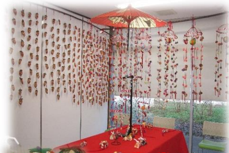
鮮やかな吊るし雛