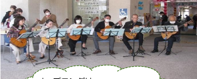
オープニングは “ギターアンサンブル メロディア”さんの演奏♪

令和5年12月3日（土）、コロナ禍を経て4年ぶりに 当地域ケアプラザのお祭り『そよ風フェスタ』が開催され ました。当日は地域の皆様に多数ご来館いただき、楽しく 賑やかに無事終了することができました。これからも幅広 い世代の方々にお越しいただける施設でありたいと思っ ております。今後ともよろしくお願いたします。