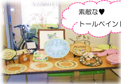
素敵な♥ トールペイント

令和5年12月3日（土）、コロナ禍を経て4年ぶりに 当地域ケアプラザのお祭り『そよ風フェスタ』が開催され ました。当日は地域の皆様に多数ご来館いただき、楽しく 賑やかに無事終了することができました。これからも幅広 い世代の方々にお越しいただける施設でありたいと思っ ております。今後ともよろしくお願いたします。