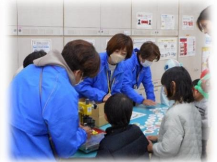
“絵本の読み聞かせ” “缶バッチ作り” “バルーンアート” “手芸教室”等たくさんの方が参加してくださいました。