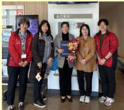
▲式典後、スタッフと共に記念撮影！

今回、平成28年から当地域ケアプラザのデイサービスにおいて、入浴した後のお客様のドライヤーかけや傾聴等の活動をされているボランティアさんが社会福祉功労表彰を受賞しました。受賞されたボランティアさんは、日頃から、お客様に合わせたお声かけを実践され、お客様やスタッフから信頼されている存在です。いつもボランティア活動をしていただき、ありがとうございます！本日は、おめでとうございます！