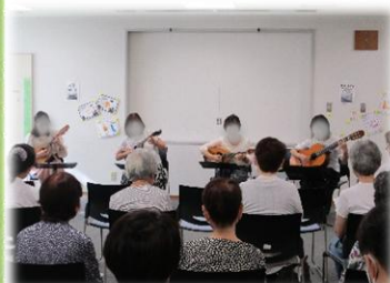
【マンドリンアンサンブル アマービレ 様】

両日とも大盛況で、プログラムには有名な曲や元気の出る曲が多く、自然と観客も一緒に歌いながら、楽しい時間を過ごしていました。