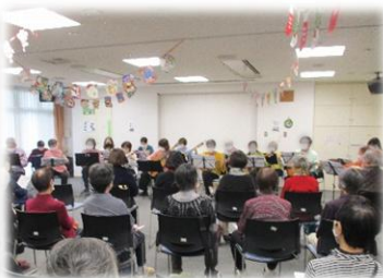
【イルヴェント マンドリーノ 様】