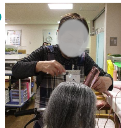
【入浴後のドライヤーかけ】